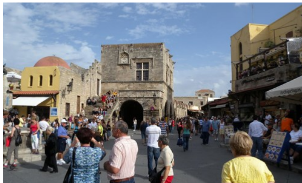
weisserstier (image cropped)

Shopping i Rhodos kan vara en fantastisk och spännande upplevelse. Kombinationen av traditionella och moderna marknader ger dig som besökare en unik shoppingupplevelse. Det finns två olika sorters marknader i en och samma stad. Folkloremarknaden och den nya marknaden med alla de kända märkesaffärerna. Till och med öppettiderna för det två marknaderna skiljer sig.