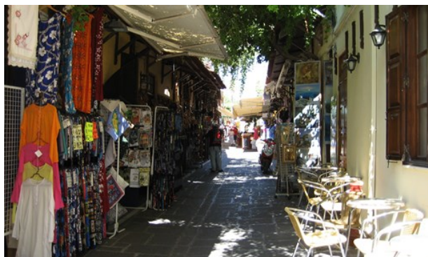
Corvair Owner (image cropped)

Mysiga och trevliga kaféer finns över hela ön, några av de bästa hittar du dock i den nya och gamla stan av Rhodos. Vad de alla har gemensamt är en bred meny, med färska juicer, förfriskningar, mysig atmosfär och en utmärkt service.