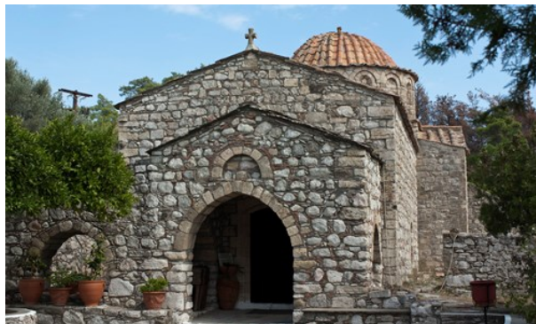
wiseguy71 (image cropped)

Rhodos erbjuder en uppsjö av aktiviteter året runt. Öns naturliga skönheten, gamla monument från sin långa och ofta turbulenta historia, en underbar atmosfär, liksom en varm gästfrihet från Rhodos befolkning.